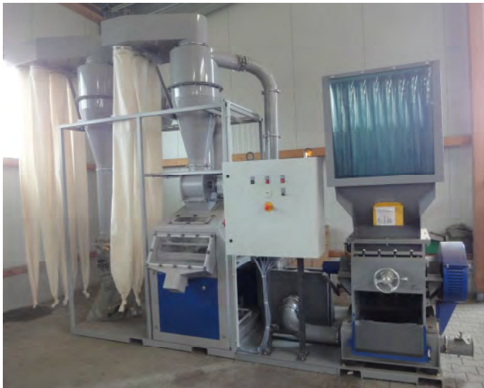
Abbildung 1: Frontansicht

niedrige Bauhöhe, geringer Platzbedarf, Reinigungs- und wartungsfreundliche Anordnung der Komponenten, kurze Montagezeit und nicht zuletzt der günstige Preis.