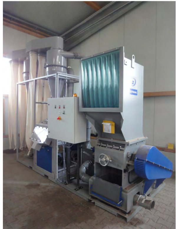
Abbildung 2: Seitenansicht