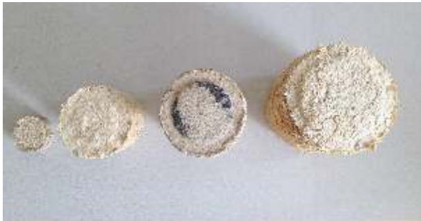
Ø=30 mm Ø=50 mm Ø=60 mm Ø=70 mm