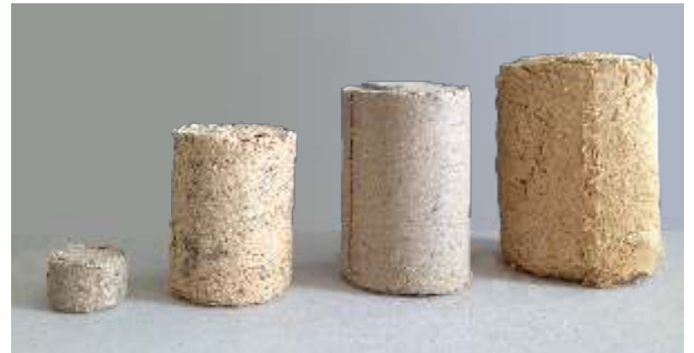
Ø=30 mm Ø=50 mm Ø=60 mm Ø=70 mm

Holz hackschnitzel, Sägespäne, Sägemehl etc. fallen in allen Handwerks- und Industrie-betrieben der Holzverarbeitenden Industrie an.